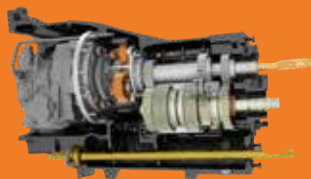
Stufenloses Getriebe von 0 bis 50 km/h