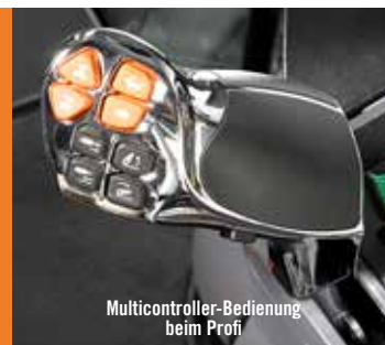
Multicontroller-Bedienung beim Profi