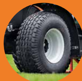
Individuelle Spezialbereifungen möglich