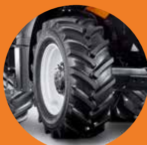
NOKIAN Forstbereifung mit verstärkter Forstfelge und Ventilschutz