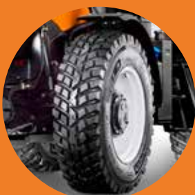
Kommunalbereifung NOKIAN TRI2