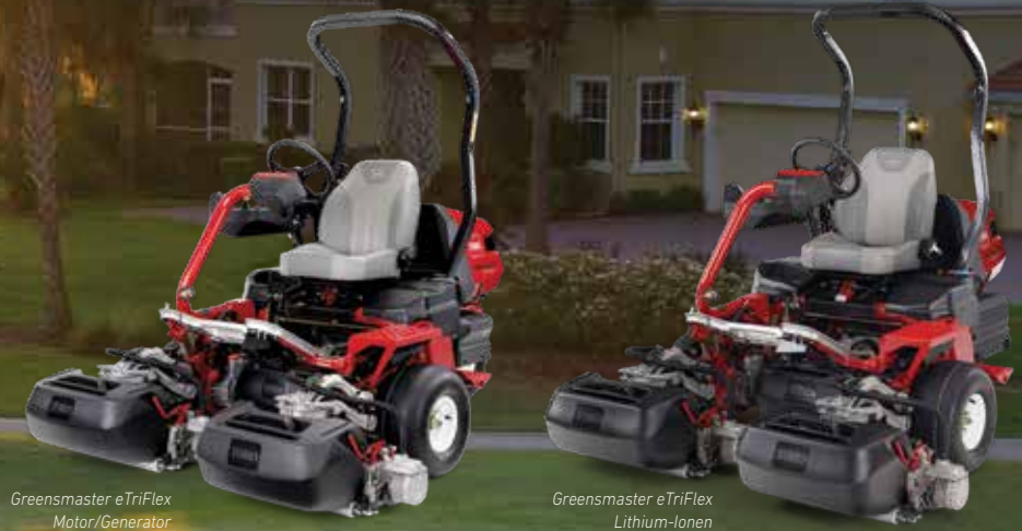
Greensmaster eTriFlex Motor/Generator

Beispiellose, hervorragende Schnittqualität, und leiser Betrieb ohne Hydrauliköl an Bord.