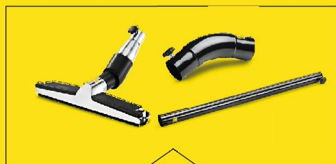
Ergänzungsset Bodenreinigung: Handgriff DN 50, Saugrohr 850mm DN 50, Bodendüse Alu 370mm DN 50