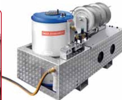
Mobile Pumpeneinheit für den Einsatz in einem Abfallwirtschaftsbetrieb. Zwei Hochdruckpumpen à 1.800 l/h und ein 200-l-Vorlauftank auf einem Gabelstaplergestell. Geeignet für viele kommunale Wirtschaftsbetriebe und Bauhöfe, die kompakte Profi-Hochdruckreiniger-Komplettslösungen benötigen.