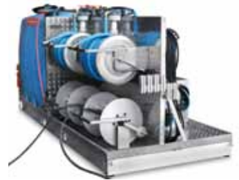
Stationäre Hochdruckanlage auf einem PKW-Anhänger für einen professionellen Reinigungsdienstleister. Zwei robuste Plungerpumpen à 2.400 l/h, Vorlauftanksystem mit 2 x 1.000 l und zwei Schlauchroller inkl. Schlauchführung mit je 100 m Hochdruck-Schlauch.

Bei der Ausführung wird auf hochwertige Materialien und Funktionalität großen Wert gelegt!