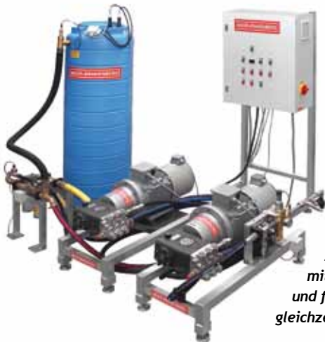
Frequenzgeregelte Zweipumpenanlage mit 2 x 6000 l/h Leistung und für bis zu 10 Anwender gleichzeitig.

Nicht alltägliche Anforderungen verlangen individuelle Lösungen!