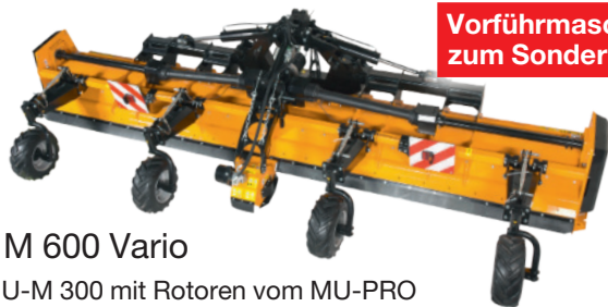
Vorführmaschine zum Sonderpreis